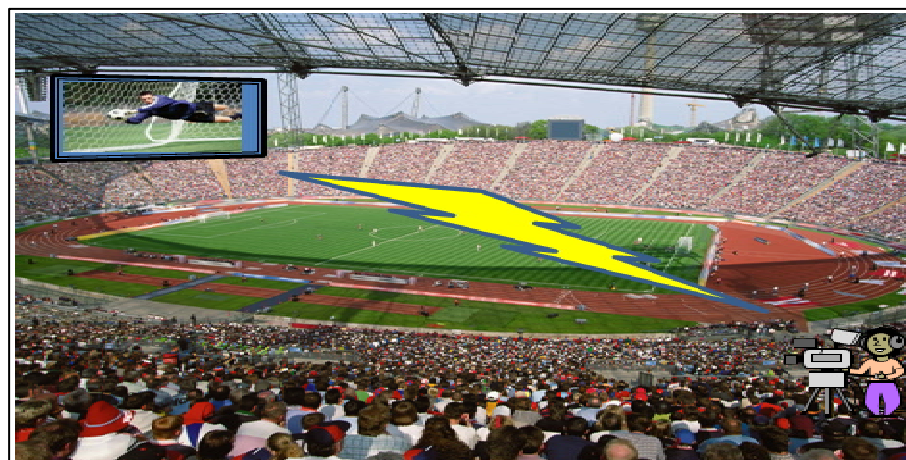
【野外イベント等における遅延のない中継回線】