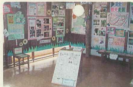
市中心部「徳山駅ビル」に設置している中山間地域情報発信基地「田舎ばあちゃん家のえんがわ」。