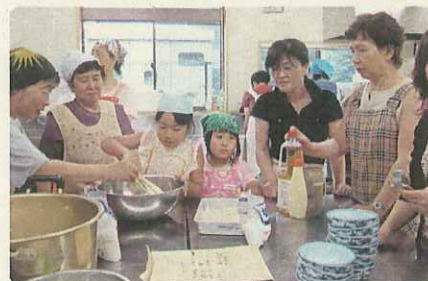
豆腐を中心とした加工品づくりの体験指導に地区外にも出向く。子ども達への技術伝承にも取り組んでいる。

このように住民が主体となり、地元資源を使い都市部住民との交流を図る取組みとして評価された。