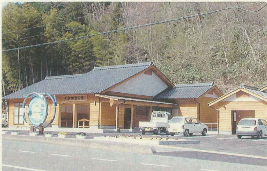
平成14年4月リニューアルオープンした地区の“へそ”「大潮田舎の店」。