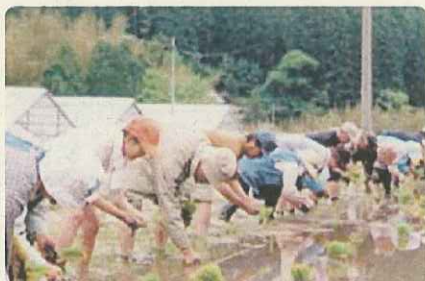
もち米づくりと餅つき体験交流では、昔風の田植えを行っている。何とも言えない泥の感触と達成感に感動。