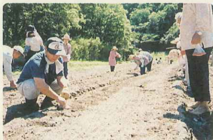
大豆の種まきに汗をかき都市住民、秋には収穫と豆腐づくりが待っている。