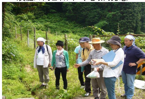
なりわい塾フィールドワーク