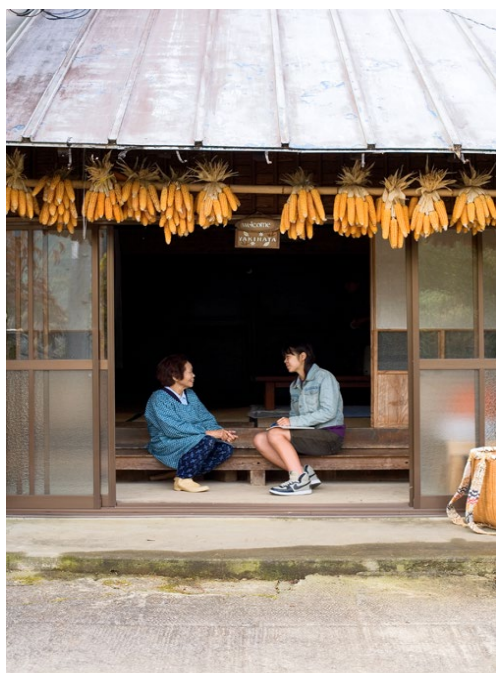
聞き書き甲子園(2002～現在)

地域を都市化するための活性化は目指さず、これからの理想的な社会の創造を目指します。問題を抱えているのは大都市であり、地方において持続可能な社会づくりに取り組んでいます。そのために、食料、水、エネルギー、医療、福祉、教育、安全、経済、金融などの地域内循環系の確立が不可欠です。地域内循環経済を大きくするには、地域住民による価値づけ(価格決め、地産地消)と流通システムの構築といった関係性の再構築が不可欠であり、これらの試みを地域住民と取り組んでいます。同時にその社会を担う教育もとても重要です。学校教育の改変(高校魅力化など)だけでなく、社会教育の拡充にも取り組んでいます。その基盤は、すでに長年にわたって地域が育んできた地域コミュニティであり、祭りや、お役などに他ありません。そのような活動から、「里山資本主義」「なりわい塾」「おいでん・さんそんセンター」などが生まれました。