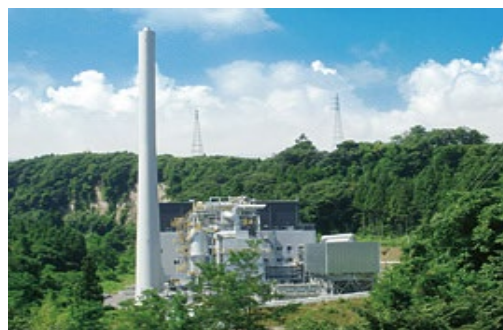
真庭バイオマス発電所 (真庭バイオエネルギー、地域内売電)