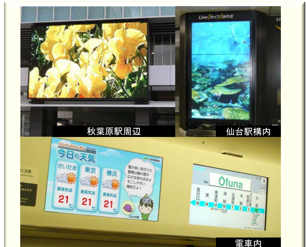
<デジタルサイネージの設置事例>