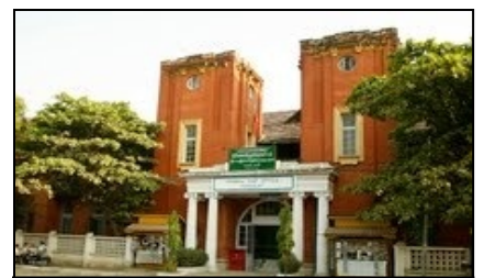
マンダレー郵便局