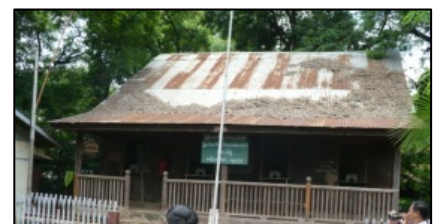
ミイトウンジェ郵便局