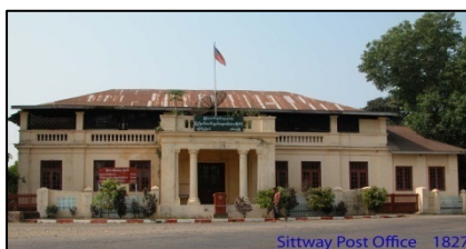
シットウェイ郵便局