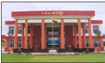
ネーピードー中央郵便局