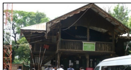
ウェストウィング郵便局