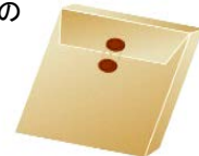
1,000円を超える信書便物