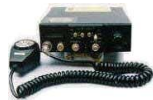
不法市民ラジオ送受信機