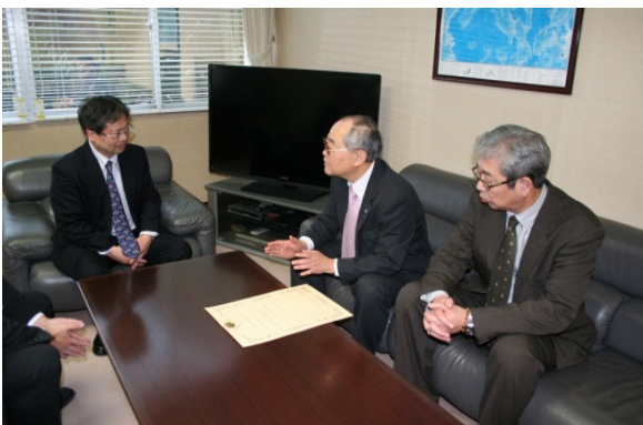
許可状の交付後に懇談