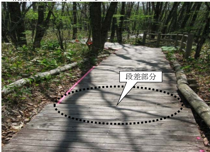
〈階段の段差が分かりづらい例〉