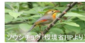
ソウシチョウ