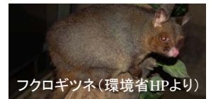
フクロギツネ