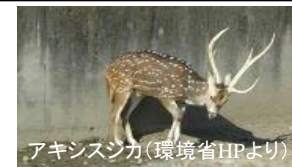
アキシスジカ(環境省HPより)