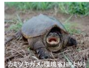
カミツキガメ(環境省HPより)