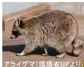
アライグマ