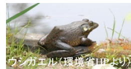
ウシガエル