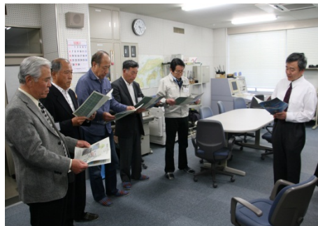
新任研修(電波監視施設見学)