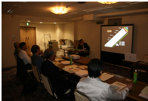
新任研修(電波法令等の講義)