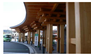
組柱9本で支えられる「真庭回廊」は、合併9町村の象徴