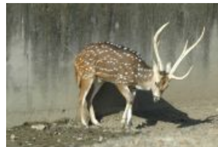
アキスジカ