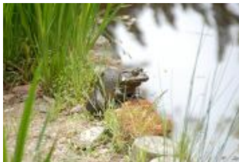
ウシガエル