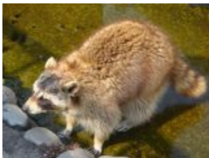
アライグマ