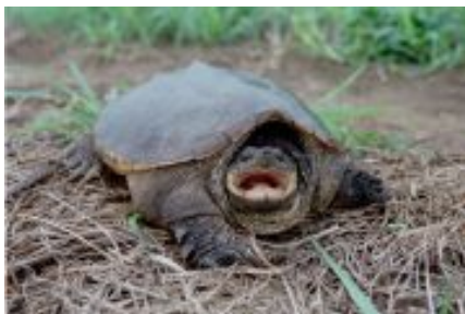
カミツキガメ