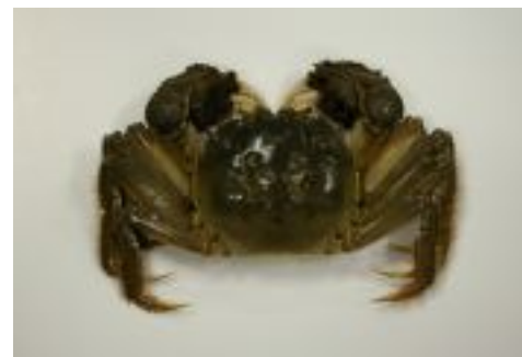
モクズガニ