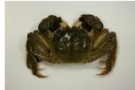
モクズガニ(環境省HPより)