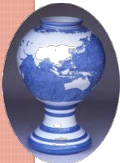
砥部焼「生命の碧い星」 国連欧州本部(スイス・ジュネーヴ)