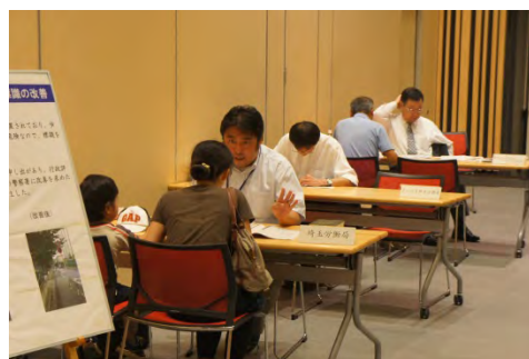
春日部一日合同行政相談所