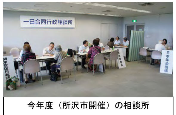
今年度(所沢市開催)の相談所

本件照会先：行政相談課 奥山、佐藤 TEL：048-600-2311、FAX：048-600-2335 電子メール：knt31@soumu.go.jp