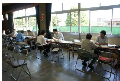
川越一日合同行政相談所