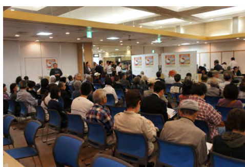
さいたま一日合同行政相談所