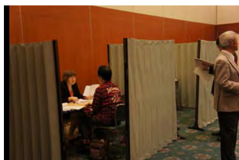
川口一日合同行政相談所

平成 26 年度は、6 月 27 日（金）に所沢市役所で一日合同行政相談所を開設し、211 件のご相談を受け付けました。