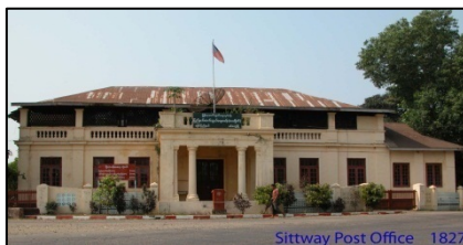
シットウェイ郵便局