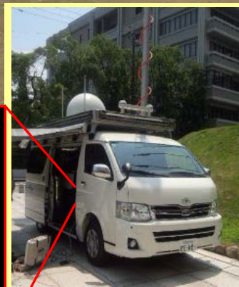
世界初NICTフルオート小型車載地球局