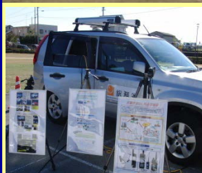
総務省 電源車も出動