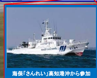
海保「さんれい」高知港沖から参加