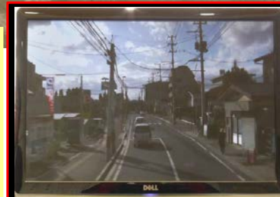
道路被害情報をリアルタイム伝送