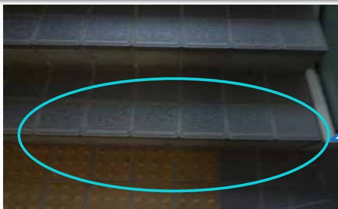
【小倉公共職業安定所庁舎】

階段の端部と踏面に明度差がないため、視覚障がい者にとっては、どこが階段の端になるか判別が難しく、足を踏み外すおそれがある。