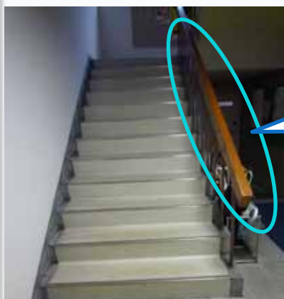
【九州農政局福岡地域センター】

手すりの形状が四角状となっており、握力の弱い高齢者にとって握りにくい形状となっている。