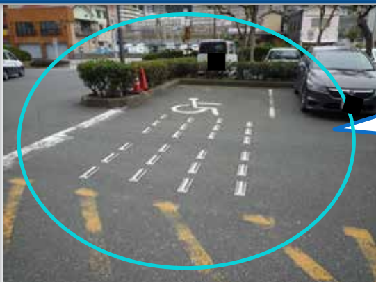
【門司港湾合同庁舎】

車いす使用者用駐車場が設置されているが、この近辺に車いす使用者用駐車場の位置を示す標識が設置されていないため、車いす使用者が駐車する際に車いす使用者用駐車場の位置が分かりづらい。