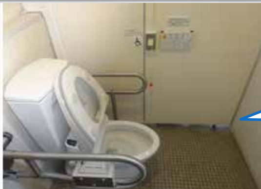
【伊万里港湾合同庁舎】

車いす使用者用便房内部のスペースがせまいため、車いすによる便房内の円滑な移動が困難となっている。