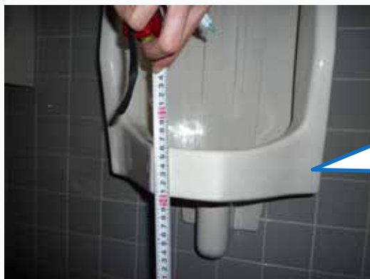
【福岡森林管理署庁舎】