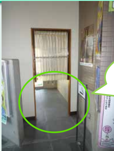
【大牟田労働基準監督署】

喫煙室の出入口の戸が上半分しか設置されておらず、空いている下の部分から、喫煙室内の煙が庁舎内に漏れるおそれがある。