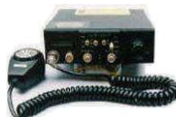
不法市民ラジオ送受信機