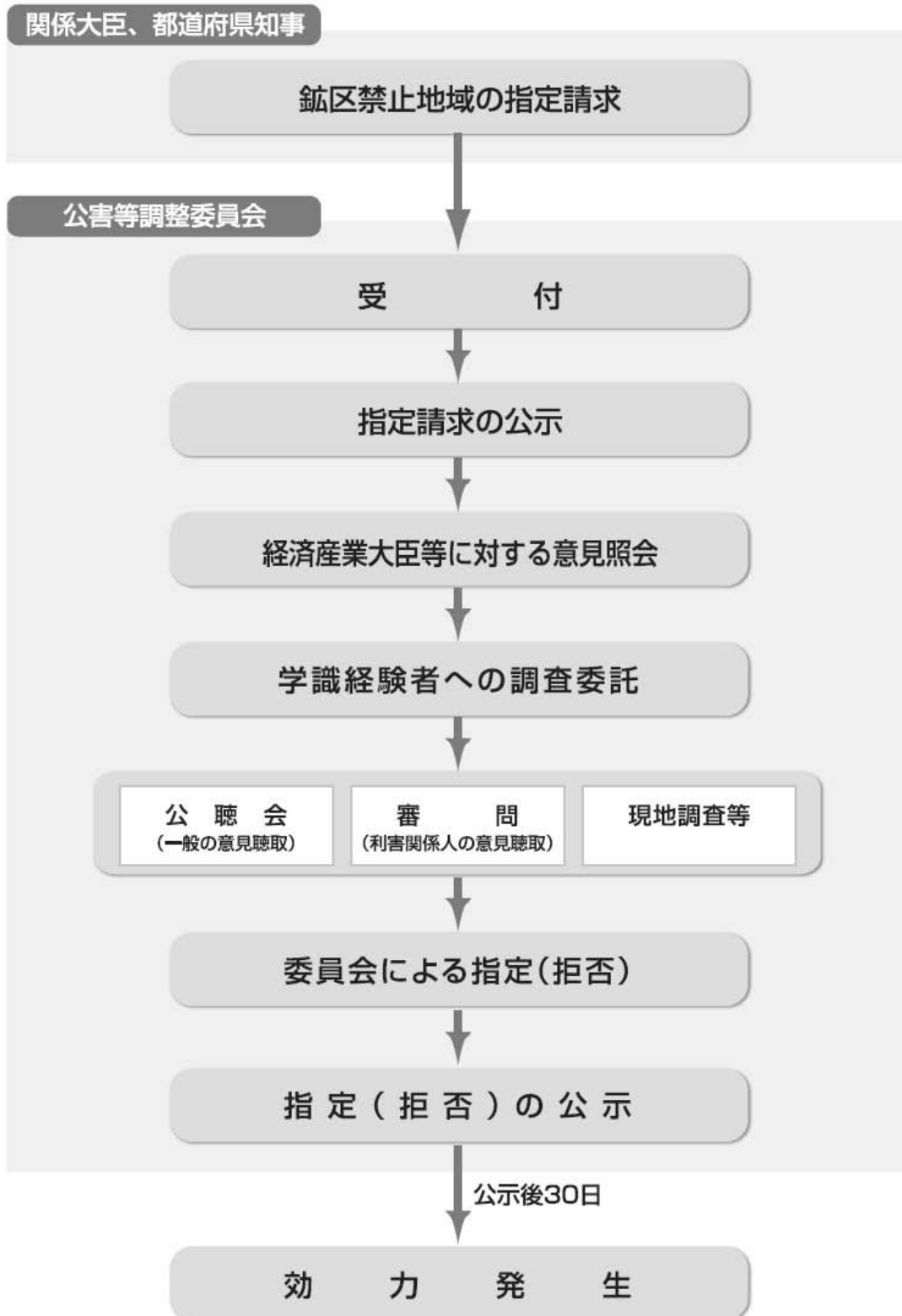
図 2 - 1 - 1 鉱区禁止地域の指定制度