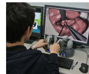
図 1 手術シミュレータ

従来の画面内における仮想現実体験(図 1)では、ユーザの身体と仮想物体との空間的位置関係が整合しておらず、触感も無いため触れたという認識があいまいで、仮想物体の操作は容易でなかった。空中立体映像への直接的なコンタクトと装着型装置による力触覚提示を連携・最適化することで、これまでにない高度なインタフェース技術を実現する。