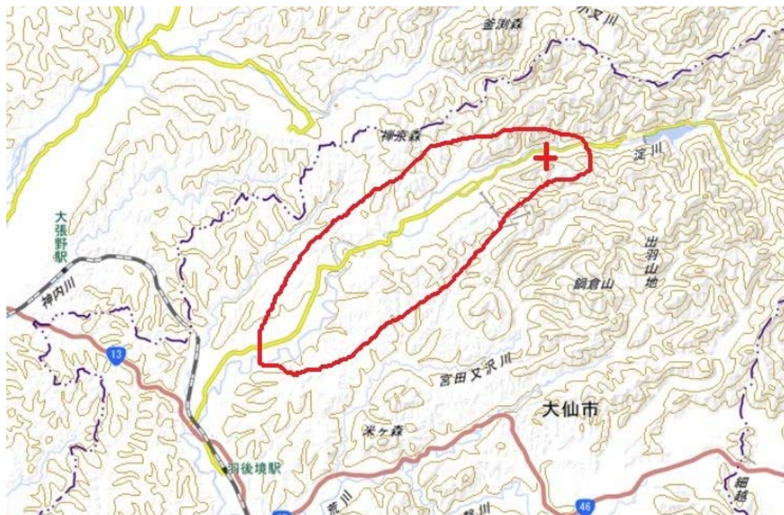
国土地理院の電子地形図(タイル)