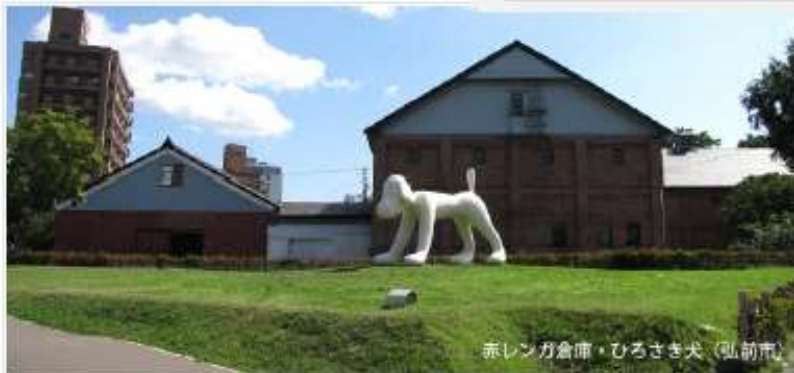
赤レンガ倉庫・ひろさき犬（弘前市）