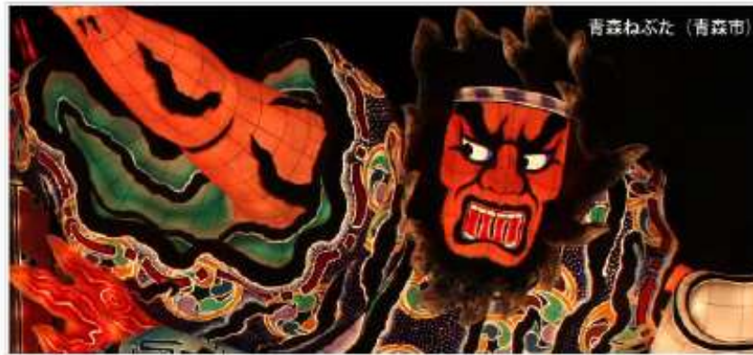
青森ねふた（青森市）

青森市、弘前市、八戸市の「いいね！あおもり」を盛り込んだ 飲食店情報紹介Facebook対応ポータルサイト