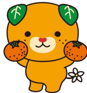
愛媛県イメージアップキャラクター「みきゃん」