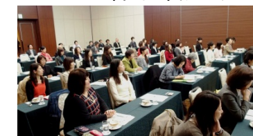
多数の女性が参加者