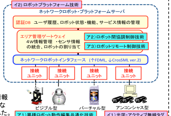
図1 ネットワークロボットプラットフォームとロボットPnP技術の各要素技術との関係

(I) ロボットプラットフォーム技術： 異種・同種のロボットがそれぞれに取得する、ロボットと人に関する情報を共通言語（上り：FDML、下り：CrossML）でデータベースとして統合する。安心・安全なサービス実現のための人やロボットの存在位置に関する情報の取得と、プライバシーに配慮した利用権限の認証を実現するために、個人IDタグ開発（I1：光学・アクティブ無線タグ）、上記データベースおよびロボットの行動やサービスに関する情報を記述したロボットコンテンツに、人およびロボットの利用範囲に関する情報を付加し、状況認識からサービス決定までの遅延が目立たない85ms以内で安全安心な情報配信を実現するための認証システム（I2：ロボットプラットフォーム技術）を開発した。