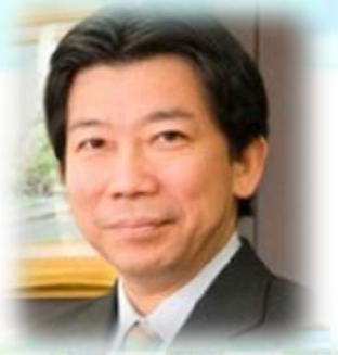
HBCラジオ 「夕刊おがわ」でおなじみ