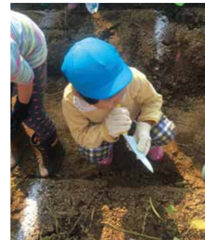
保育園での芋掘り会に参加

テレワークを使うことで、通勤時間が無くなり、時間を有効に活用できるので、育児中の私は重宝しています。総務省のテレワーク制度は柔軟に設計されており、午前・午後に分けて実施することも可能なので、例えば午前中だけ有給休暇を取得し保育園の行事に出席した後、午後から自宅でテレワーク勤務ということも可能です。テレワークにより子どもと過ごす時間が増え、メリハリをつけて仕事に取り組む毎日です。