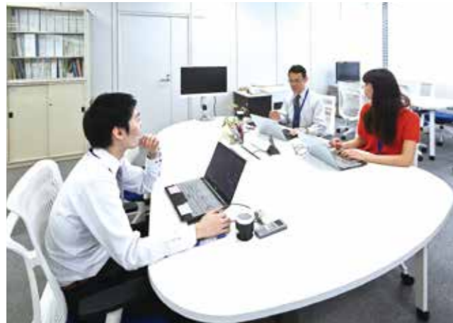
フリーアドレス制でペーパーレスオフィスを実現、情報共有も円滑に

これまでの霞ヶ関にはなかった新しいスタイルのオフィス。皆さんもここで働いてみませんか。