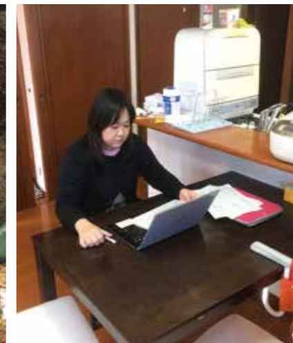
午後から自宅でテレワーク勤務