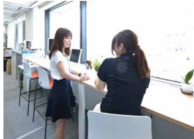
コミュニケーションスペースで意見交換