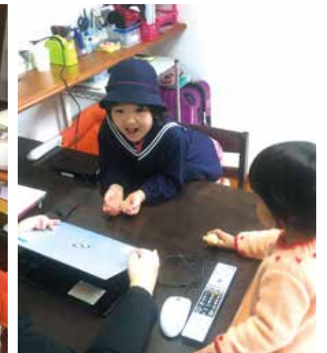
子どもが帰ってきたのでテレワークは終了