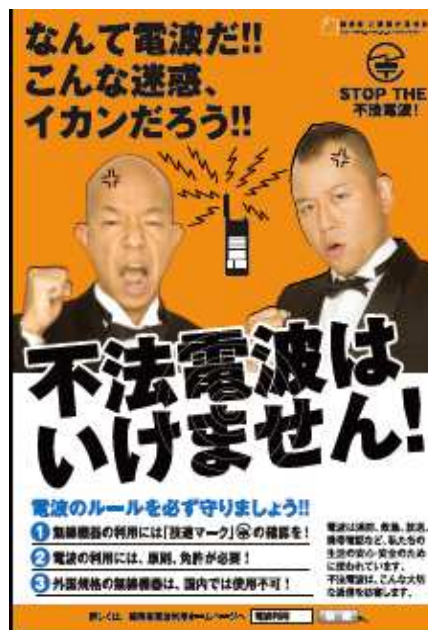
【平成28年度 周知啓発用ポスター】