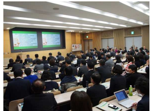
2月に開催した京都でのシンポジウムの様子