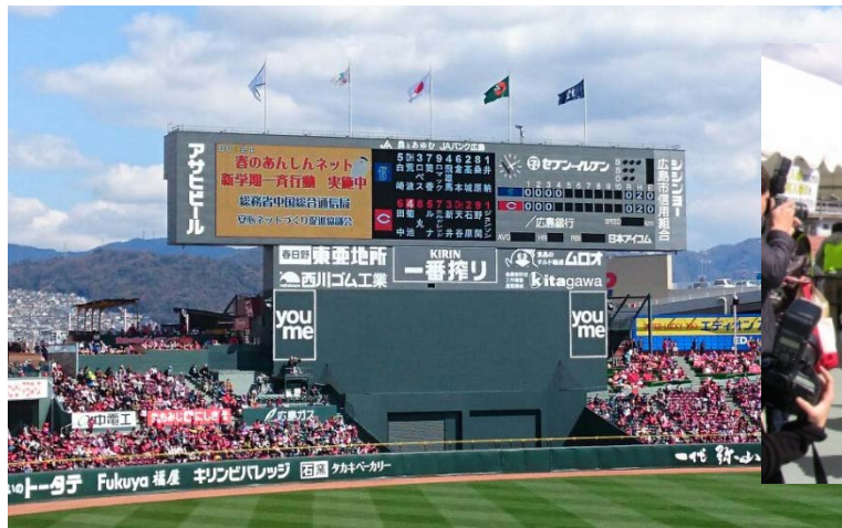
▲マツダスタジアム