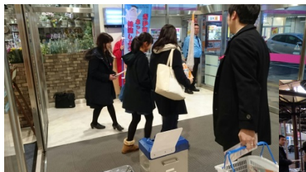
2月2日ゆめタウン山口300部配布