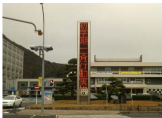
鳥取県電光掲示版