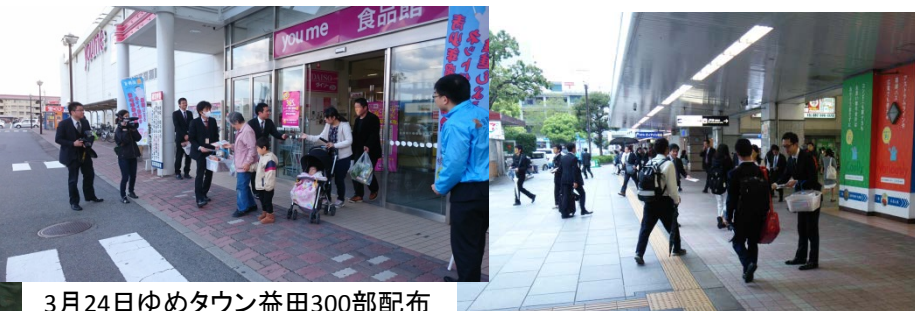
3月24日ゆめタウン益田300部配布