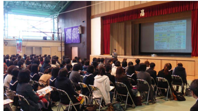
▲島根県立益田高校

※ILAS:総務省が行っている、高校1年生を対象としたインターネットリテラシーテスト。