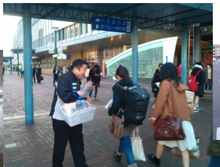
3月3日JR岡山駅1000部配布