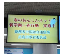
広島市西区役所デジタルサイネージ