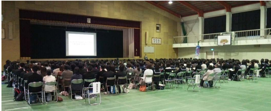
▲山口県立山口農業高校

☞ 保護者と生徒合同で説明、家庭でネットの安心・安全について話し合うきっかけづくりに