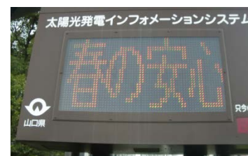
山口県インフォメーションシステム