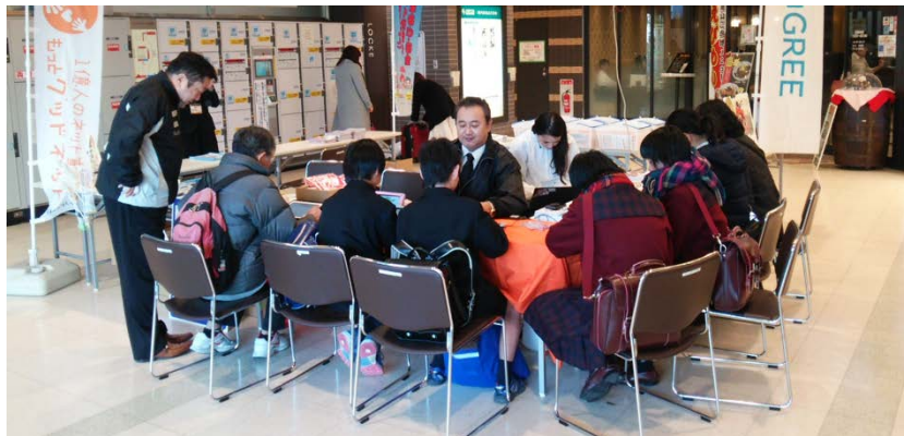
サンフェスタ広場でデモ体験

☞ 安心ネットづくり促進協議会と協力して、ゲームをしながら情報モラルを学べるアプリ等を体験、120名が来場。