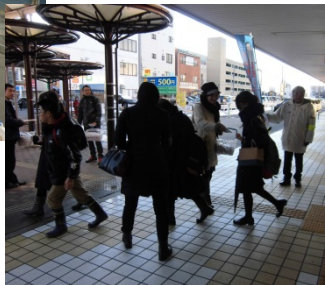
2月16日JR鳥取駅400部配布