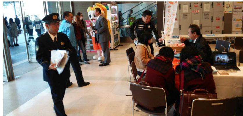
岡山県マスコット“ももっち”も協力