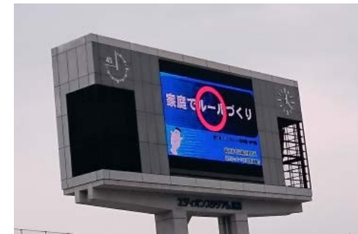
▲エディオンスタジアム