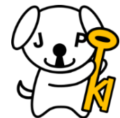
愛称 「マイキーくん」