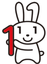
愛称 「マイナちゃん」