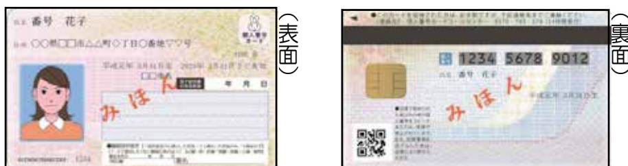
例1 マイナンバーカード

※ マイナンバーカードの写しで本人確認を行う場合は、 表面及び裏面の写し が必要となりますのでご注意ください。