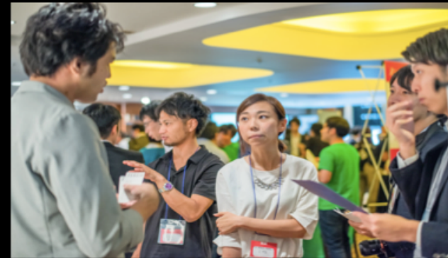
テイクアンドギブニーズ（結婚式場）x リクルート

2年間借り手がなかったビルのフロアを、スペースマーケットと共同でレンタルスペースに変更し、毎月100-200万売上があるスペースへの転換に成功。