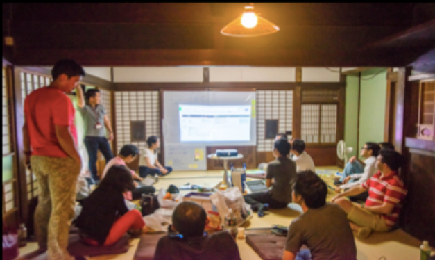
古民家 x KAIZEN Platform

ほぼ空き家だった古民家が企業のオフサイトミーティング、合宿等で活用され、月30万円以上の売上