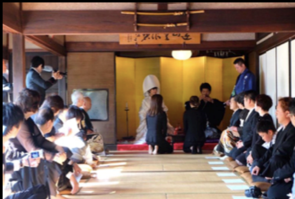
古民家 x 結婚式