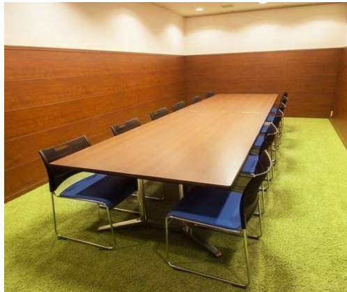
会議室 (ハロー会議室)