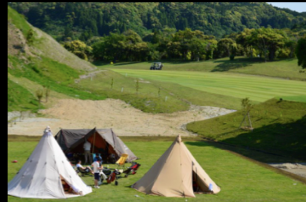
ゴルフ場 x キャンプ