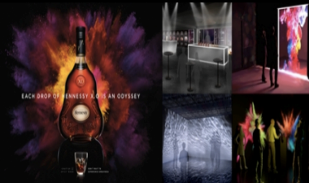
平和不動産 x モエ ディヘネシーアジオ

ほぼ空き家だった古民家が企業のオフサイトミーティング、合宿等で活用され、月30万円以上の売上