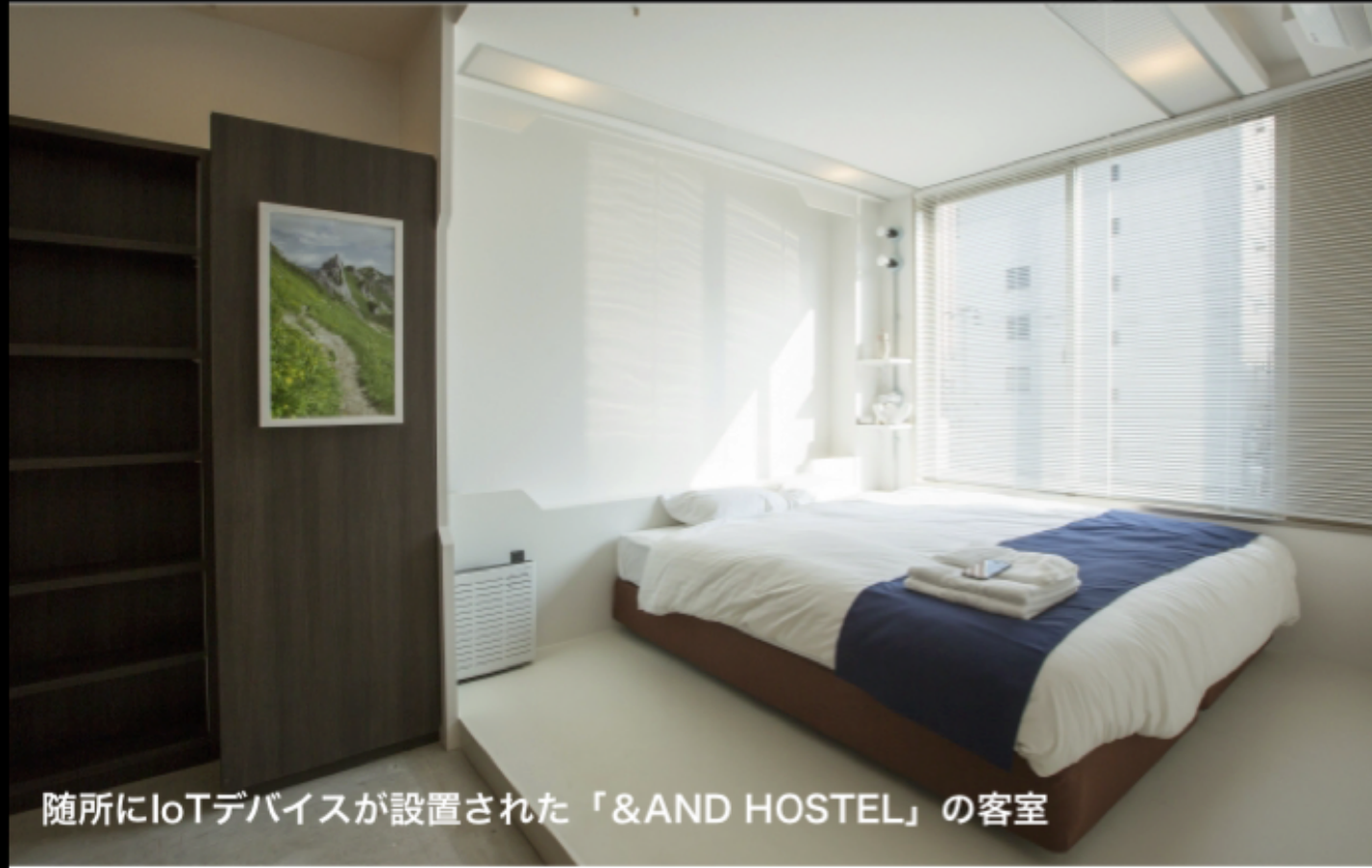
随所にIoTデバイスが設置された「&AND HOSTEL」の客室