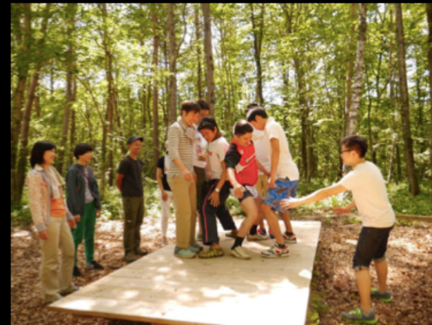
合宿施設 X チームビルディング

借り手のなかったアパートの1Fを貸し出し。子供の誕生日会場の他、地域の会議やイベントスペースに