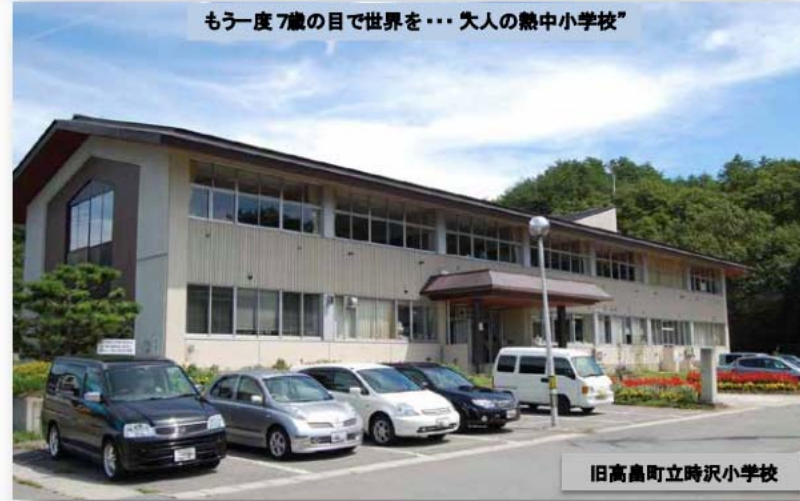
旧高島町立時沢小学校