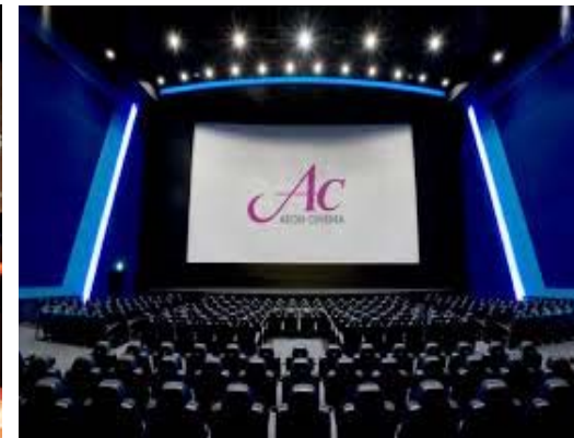
映画館 (イオンシネマ)