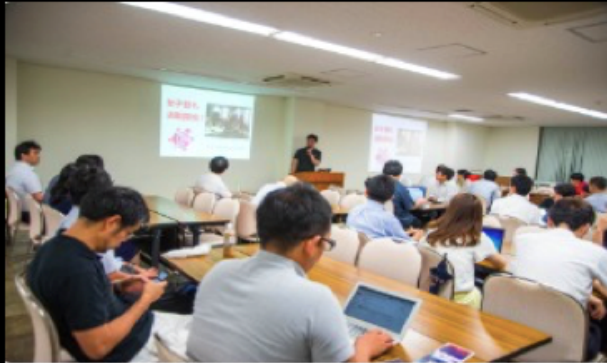
かんべ土地建物 CHAIRS x IBM

2年間借り手がなかったビルのフロアを、スペースマーケットと共同でレンタルスペースに変更し、毎月100-200万売上があるスペースへの転換に成功。