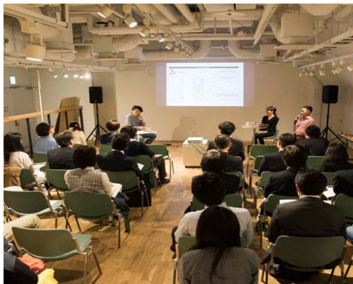
イベントスペース (リビタ)