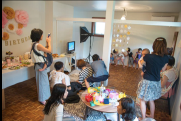
有休アパート x Happy Birthday Cafe

借り手のなかったアパートの1Fを貸し出し。子供の誕生日会場の他、地域の会議やイベントスペースに