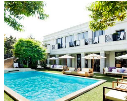
結婚式場 (青山迎賓館)