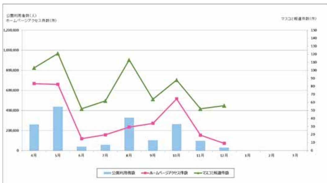
図 ホームページアクセス件数とマスコミによる報道件数、利用者数の推移