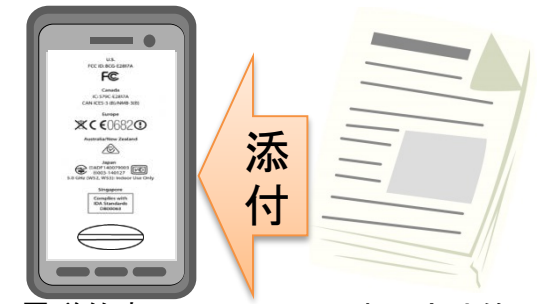
電磁的表示の付された設備