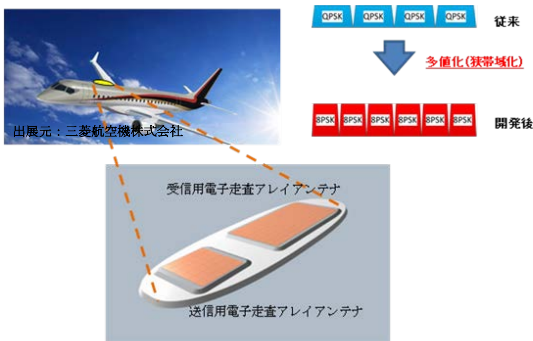
図1 小・中型航空機搭載用の薄型電子走査アレイアンテナ概念図

具体的には、図2のとおり、8PSK による多値化でチャンネル当たりの占有帯域を 3.6MHz 幅から 2.4MHz 幅と 33%の狭帯域化を実現することでチャンネル数を増加させることが可能となる。