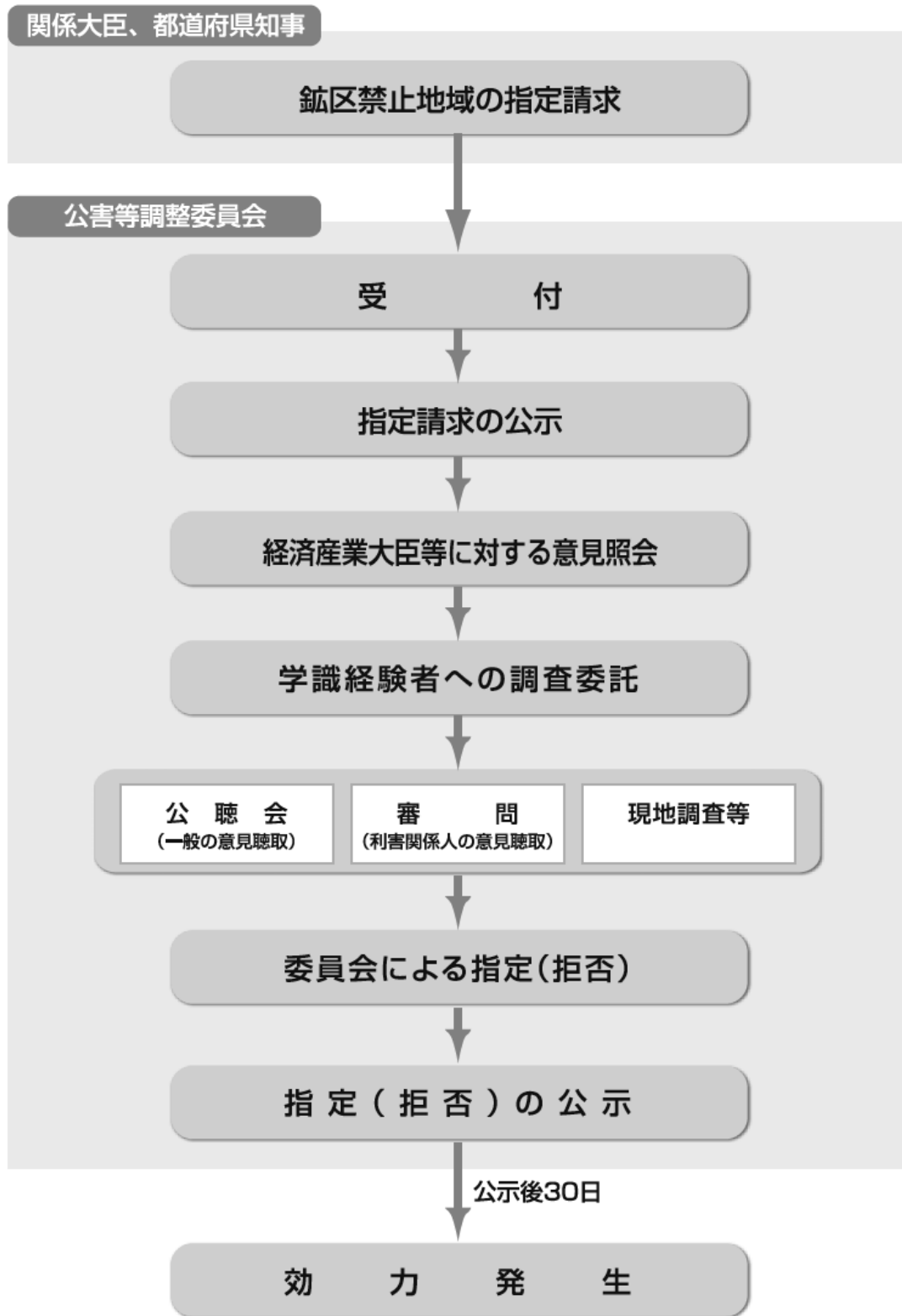
図 2 - 1 - 1 鉱区禁止地域の指定制度