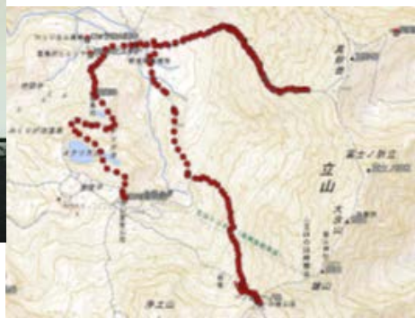
登山者位置の地図表示