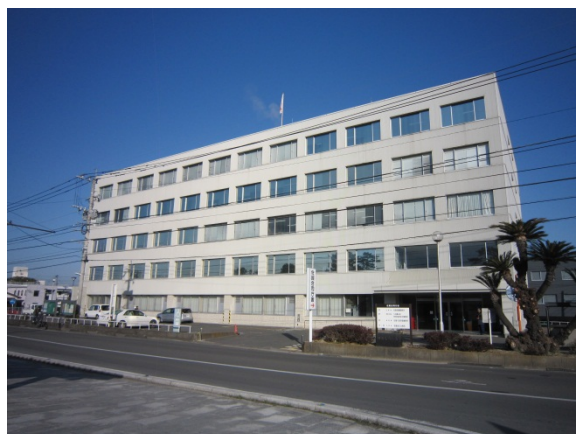
さが ごう どう ちやう しや 佐賀合同庁舎