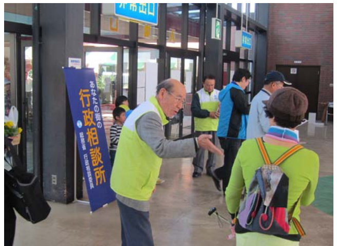
(地元住民に対する周知広報活動)