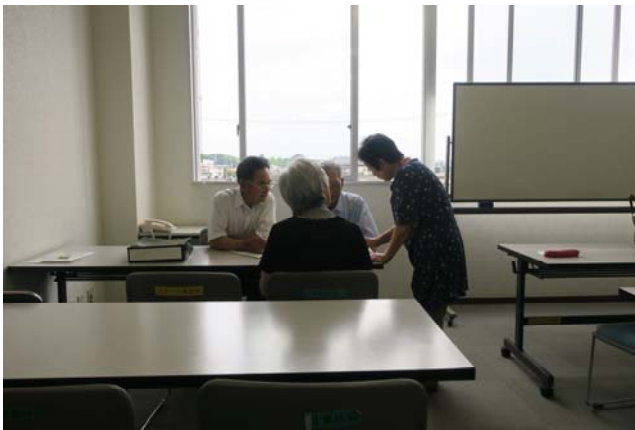
(地元商業施設での特設相談所)