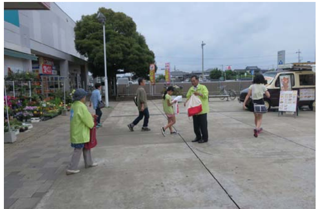
(地元住民に対する周知広報活動)