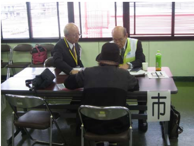
(「くらしの困りごと相談会」への協力)