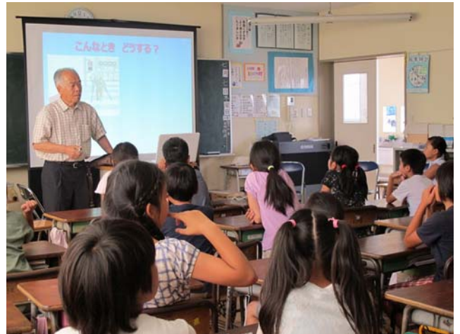
(小学生を対象とした出前教室)