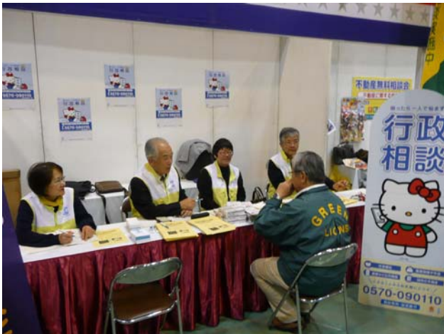
(地元イベントでの特設相談所)