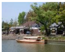
武家屋敷と堀川遊覧