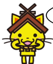
島根県観光キャラクター 「しまねっこ」 高級遊技第4602号

「ヤマトシジミ」は、宍道湖を代表する水産物で、1年間で宍道湖で採れる水産物の90%以上を占めています。