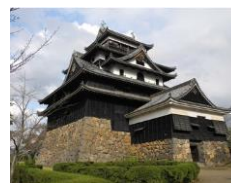
国宝に指定された松江城