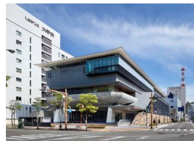
高知県立高知城歴史博物館

高知県では、今年3月から県内全域で「志国高知 幕末維新博」を開催中！高知城のすぐそばにある高知県立高知城歴史博物館をメイン会場として、県内24の会場で皆さまをお待ちしています。本物の魅力を感じ、幕末維新时期に活躍した偉人達の足跡を辿る旅を、ぜひお楽しみください。