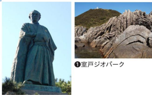
⑤桂浜 ①室戸ジオパーク