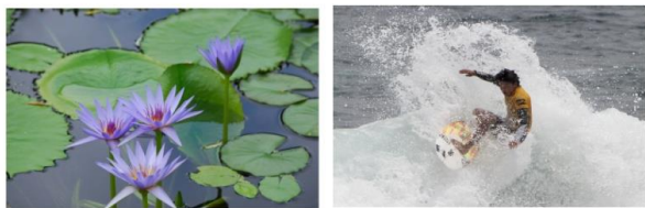
③モネの庭 ②生見海岸