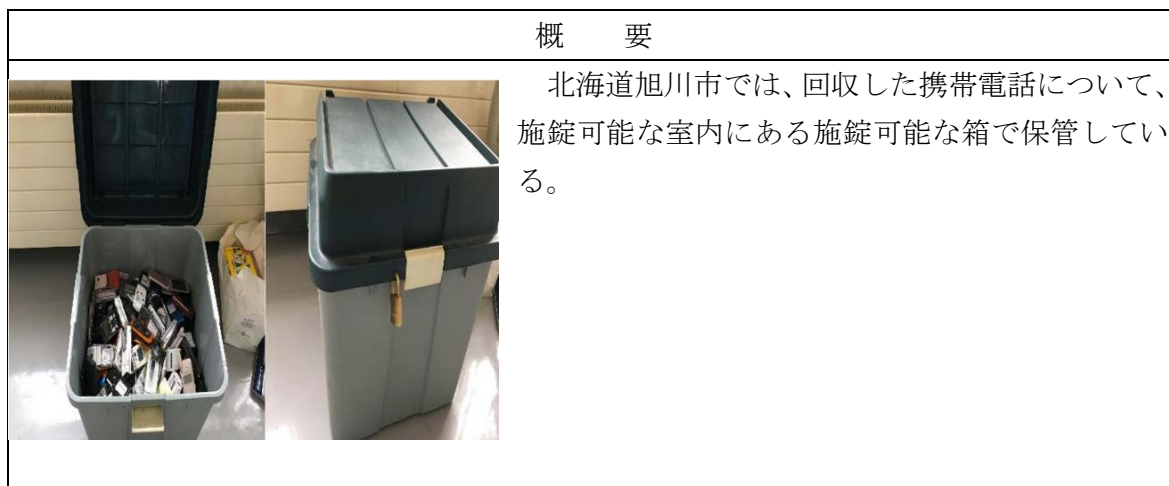
図表4-(3)-② 回収物の保管場所における個人情報の漏えい防止措置の実施内容の例

（注）残り7市町村については、再資源化事業者が回収ボックスから直接回収している等の理由から、市町村において回収物を保管していない。