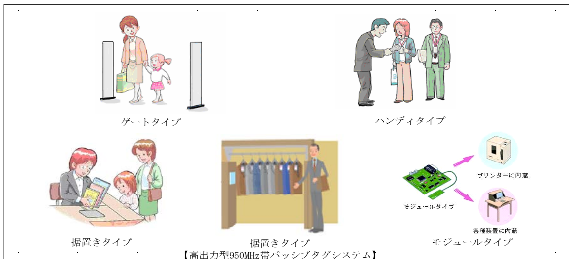
図4 各タイプのRFID機器

注3： 比較的長距離の通信が可能なUHF帯（950MHz帯）の電波を利用するRFID機器。 例えば、コンテナやパレットなどに貼付したタグの一括読み取り等のアプリケーションに使用されることが想定される。