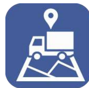
・屋内位置情報 ・屋外位置情報 ・温湿度 ・振動