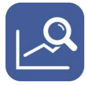
・トレンド把握 ・気象情報