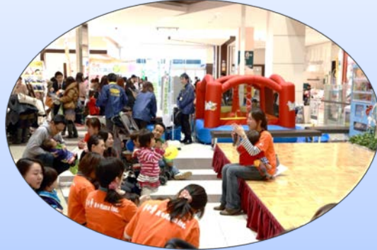
商業施設の来場誘致