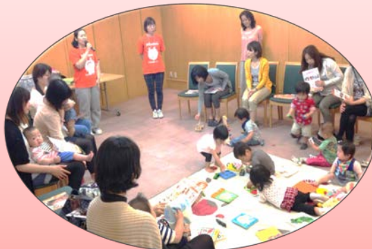
マンション・分譲地内の共隣童・習い事の保護者間共助