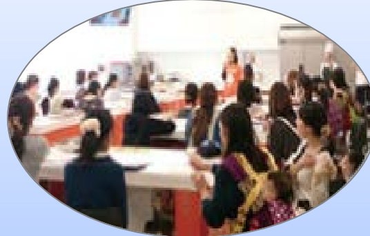
企業サービス認知拡大「託児体験付イベント」