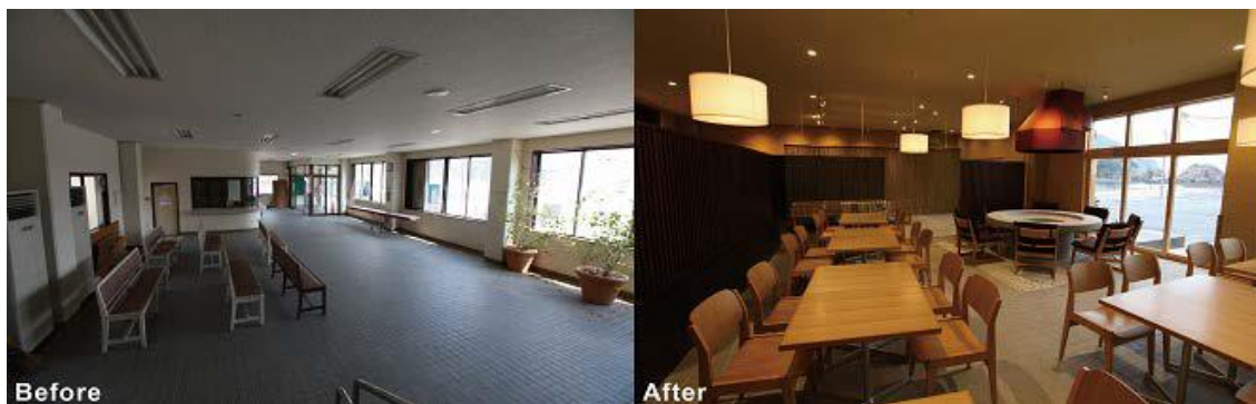
【利用されなくなった待合所を地域の拠点に…てうちん浜や】