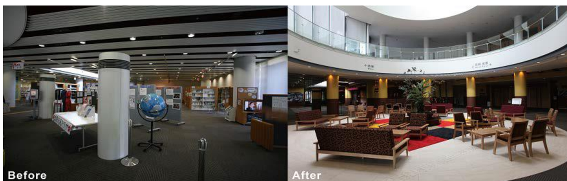
【冷たい公共施設からの脱却・・・かごしま県民交流センター】