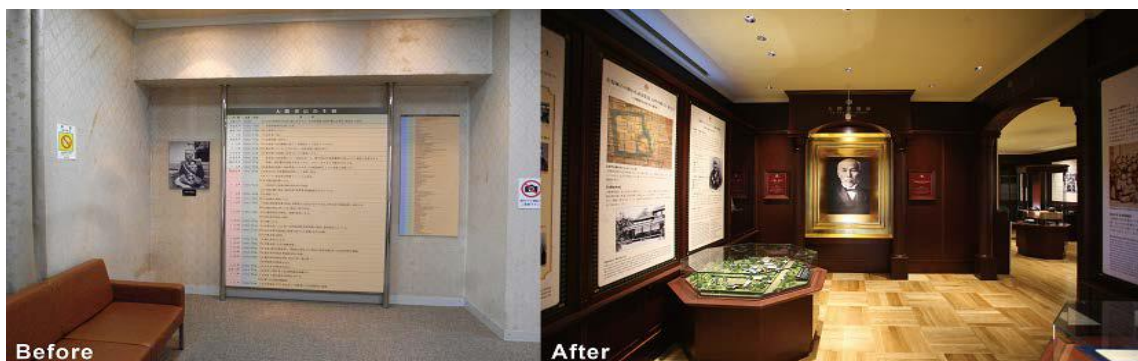
【大隈侯誕生の地でミュージアムを再生…大隈重信記念館】