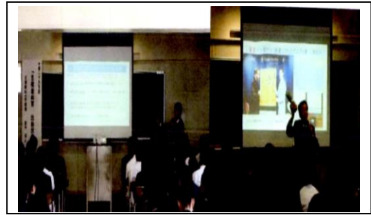
北海道札幌真栄高等学校にて