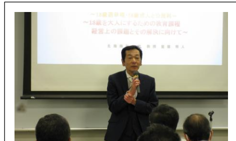
北海道高等学校政治経済研究会にて